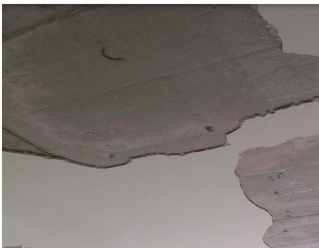
Aktueller Zustand einer Zimmerdecke.

Dieser Kredit wurde an der Urnenabstimmung vom 29. Januar 2012 mit 525- Ja- gegen 200 Nein-Stimmen angenommen, und nun können die Arbeiten weitergehen!