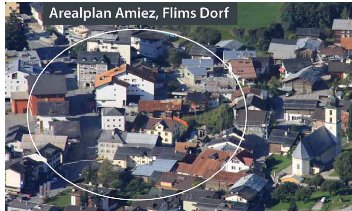
Arealplan Amiez, Flims Dorf