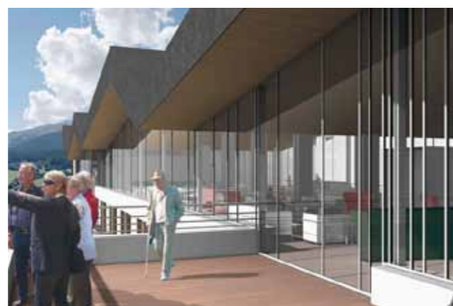
Schöne Aussichten von der geplanten Sonnenterrasse im Eingangsbereich.