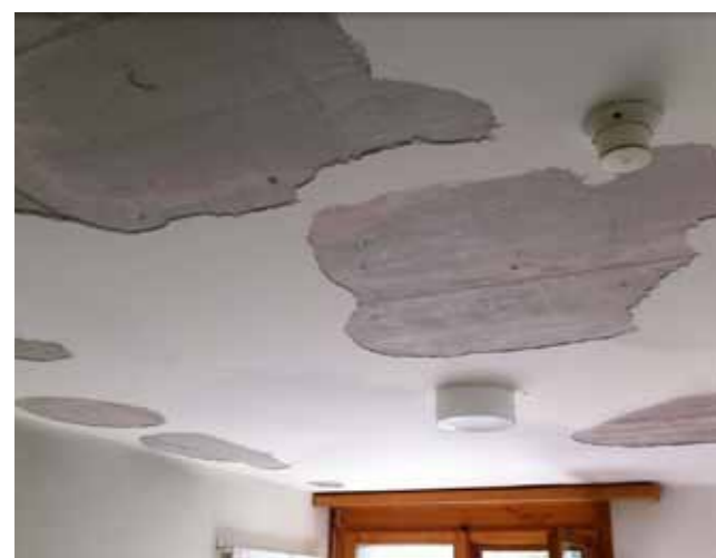
Aktueller Zustand einer Zimmerdecke.

Im Rahmen eines Projektwettbewerbes hatten sich ein Dutzend Architekturbüros über eine Erweiterung des Hauses Gedanken gemacht. Das oben gezeigte Projekt ging als Sieger daraus hervor, und die Planungsarbeiten sind in vollem Gange.